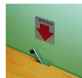
centralne zamknięcie z ławeczką